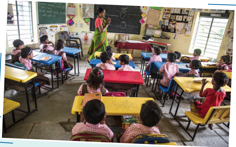
Una scuola elementare ad Amravati, in India.